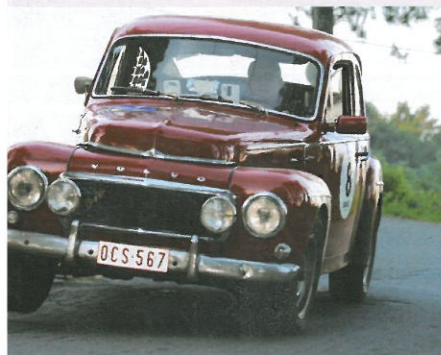
ts zorgde voor een kleine verrassing door mee te spelen als piloot van deze Volvo PV544 uit 1961. (Claessens)

Door Arnaud Dellicour & Bernard Verstraete - Foto's Juha Bos & Robert Claessens