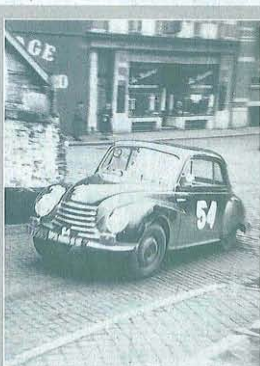
2 DANS LES RUES HUTOISES UN CONCURRENT EN ACTION