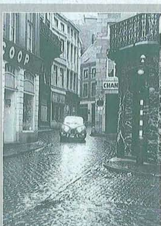
3 AUX ABORDS DE LA GRAND'PLACE EH OUI, IL Y AVAIT UN FEU ROUGE!