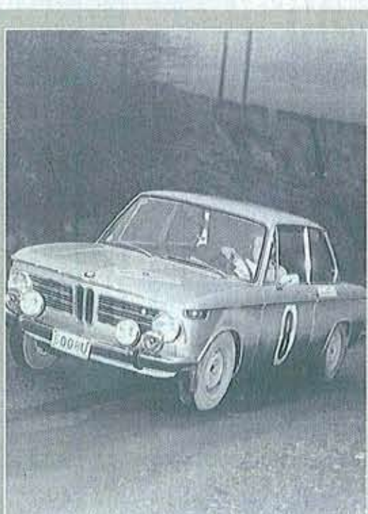
4 À BORD D'UNE JOLIE BMW ET SEUL À BORD, SVP!